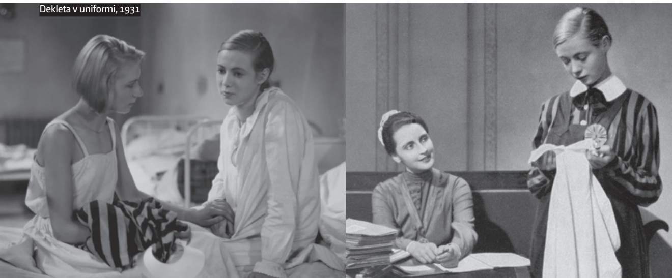
Dekleta v uniformi, 1931